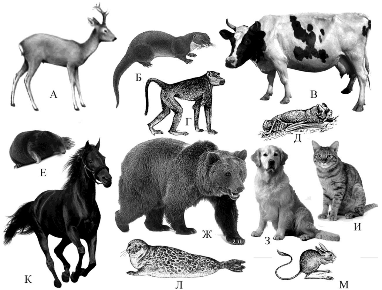
Рис. 1. Пристосування кінцівок ссавців до пересування