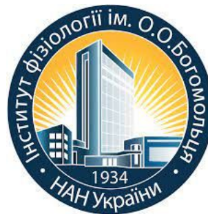
Інститут фізіології ім. О.О. Богомольця НАН України