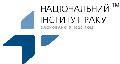
Національний інститут раку МОЗ