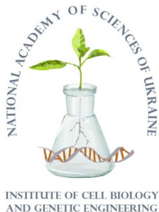
Інститут клітинної біології та генетичної інженерії НАН України