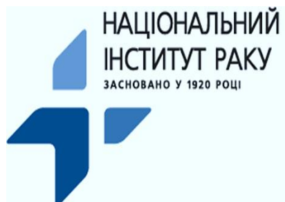
Національний інститут раку МОЗ України