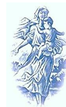
Інститут педіатрії, акушерства і гінекології імені академіка О.М. Лук'янової НАМНУ