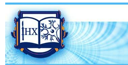
Інститут нейрохірургії ім. акад. А. П. Ромоданова НАМНУ