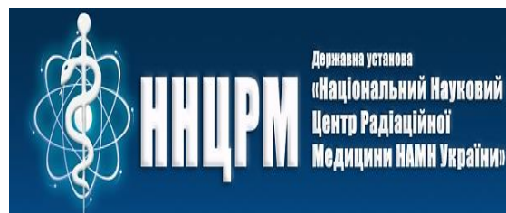
ДУ «Національний науковий центр радіаційної медицини НАМН України»