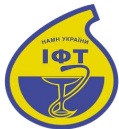
Інститут фармакології та токсикології НАМНУ