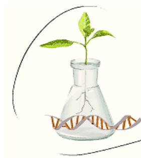
Інститут клітинної біології та генетичної інженерії НАНУ