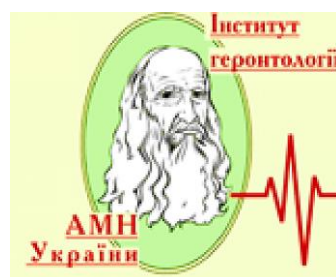
Інститут геронтології ім.Д.Ф.Чеботарьова НАМНУ